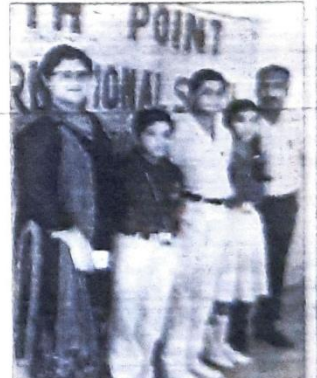
सोनीपत। भाषण प्रतियोगिता में विजेताओं के साथ स्टाफ सदस्य।

बढ़-चढ़ कर हिस्सा लेना चाहिए। उन्होंने कहा कि इसके साथ ही स्वयंसेविकाओं को चाहिए कि वे अपने