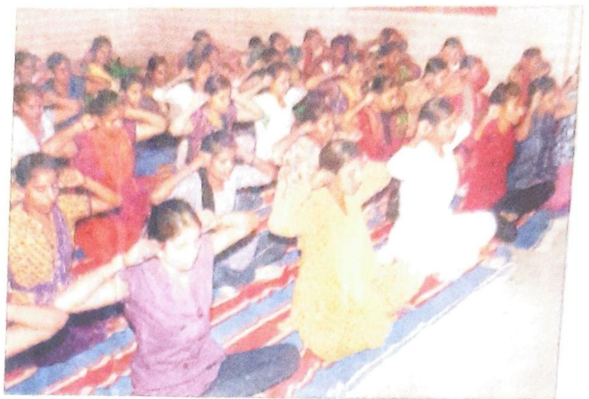
खरखोदा के सैनी गद्दी मोहल्ला स्थित सामुदायिक केंद्र में चल रहे साप्ताहिक एनएसएस शिविर में योग करती स्वयं सेविकाएं।