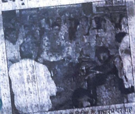
खरखोदा। कल्याण कालेज में शिविर के शुभारंभ पर यहां में आहुति डालते शिक्षक।